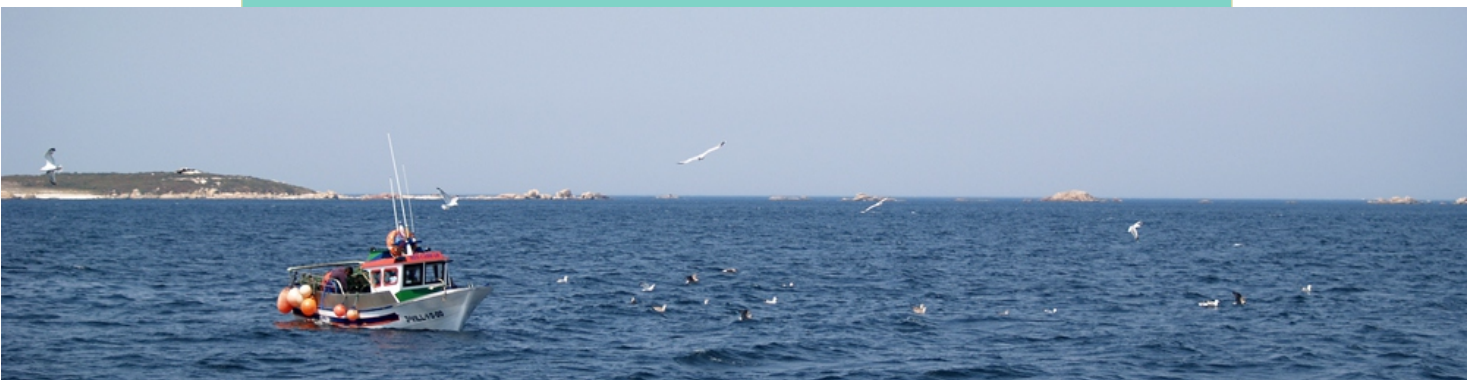
Punta de Lagos e Cons dos Asadoiros

Na contorna das illas hai unha grande actividade pesqueira e marisqueira.