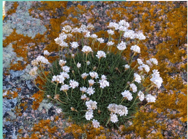
Herba de namorar