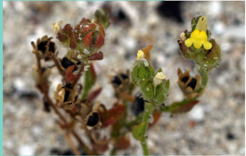
Paxariños ( Linaria arenaria ). Sálvora acolle a maior poboación de Galiza desta planta en perigo crítico de extinción.