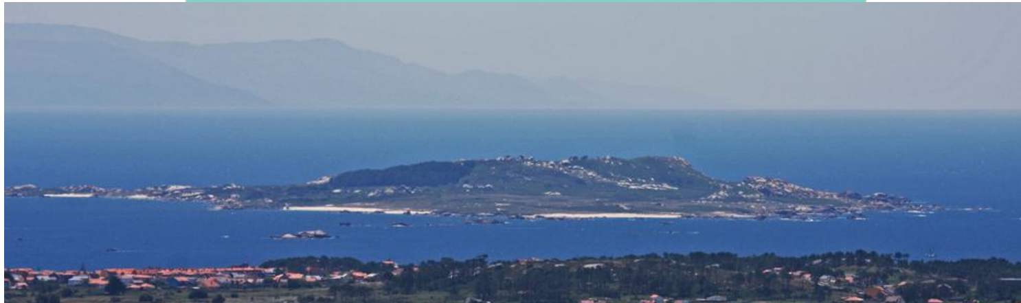
Vista norte de Sálvora: praias dos Bois e da Zafra e punta dos Pilros.