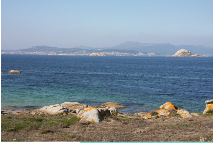
Punta dos Bois