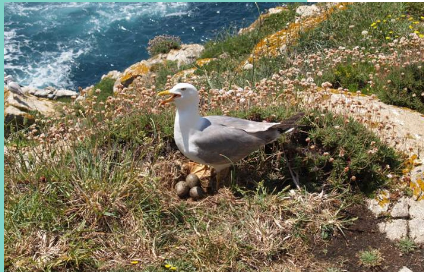
Gaivota patiamarela ( Larus michahellis ) no niño