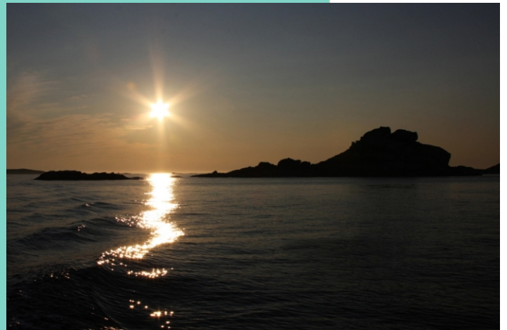
Nor e o Cabeceiro pequeno