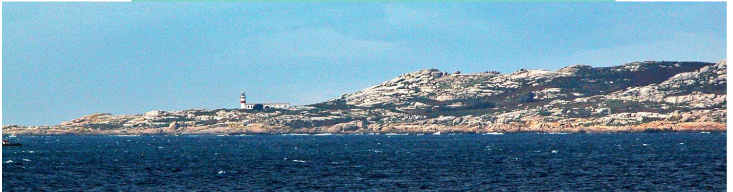
Costa sur de Sálvora ata a Punta Pirula. No centro Os Gralleiros, o cume máis alto da illa (73 m).