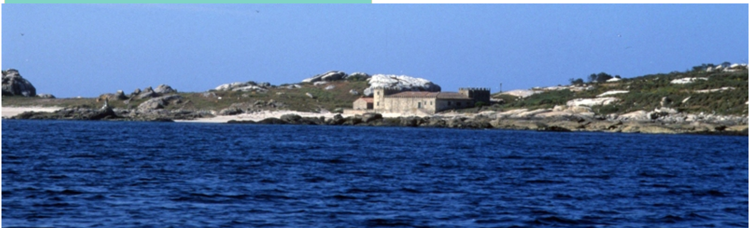
Costa de Sálvora entre a punta do Castelo e a punta do Muíño