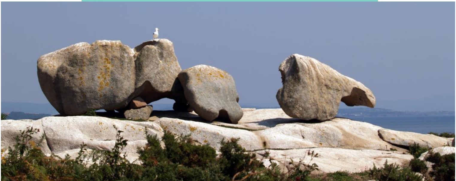
Formacións graníticas de Gralleiros. Con bolos, penedos e bloques de formas variadas. Están catalogadas como LIX (Lugar de Interese Xeolóxico)