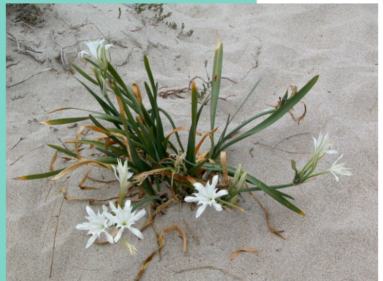
Cebola das gaivotas