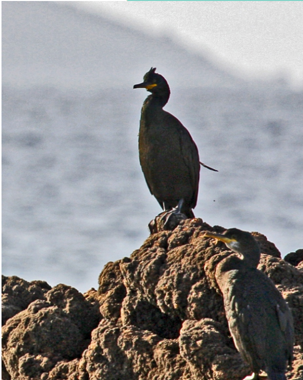
Corvos mariños cristados ( Phalacrocorax aristotelis ).

Nos cantís crían gaivotas patiamarelas e corvos mariños. No mar pódense ver mascatos, aros romeiros, pardelas, gaivotas choronas, carráns. En terra hai corvos, pombos e unha ampla variedade de paxaros (verderolos, xílgaros, pardillos, chascos, borrallentas...), lagartos, escaravellos... A fauna mariña é dunha gran diversidade, sobre todo especies de fondos rochosos.