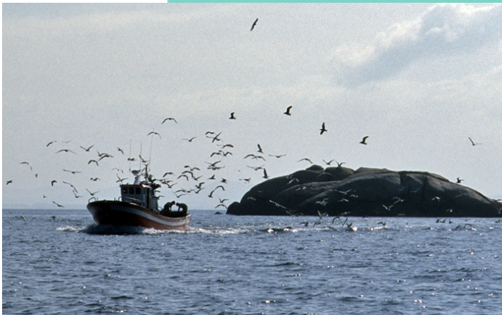
Illote O Cabezo Grande

Na contorna das illas hai unha grande actividade pesqueira e marisqueira.