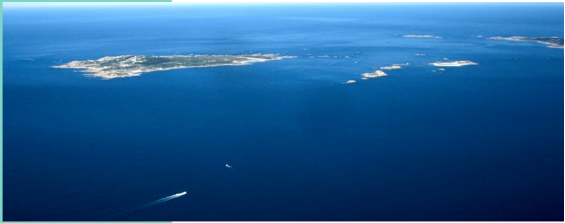
Vista aérea do arquipélago de Sálvora

-Un percorrido ata a aldea que so se pode facer con guía autorizado.