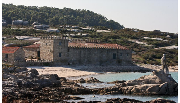
Praia do Almacén