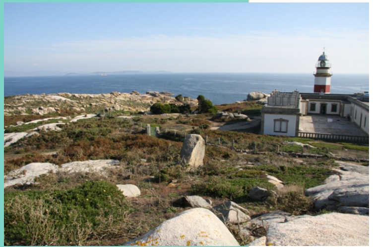
Punta Pirula e o faro.