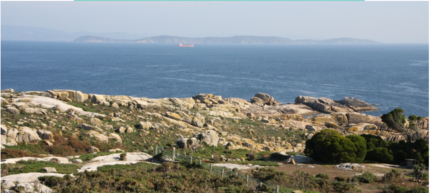
Punta Pirula e Illa de Ons desde o faro.