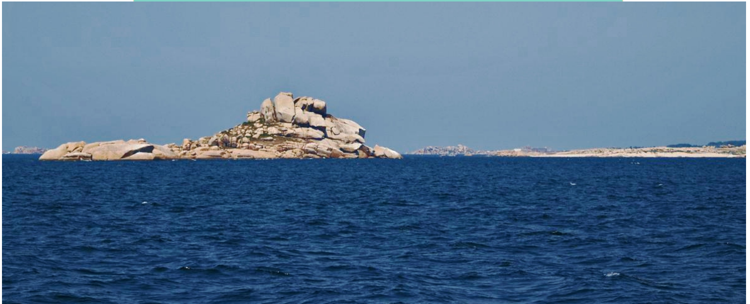
Nor, Herbosa e Vionta