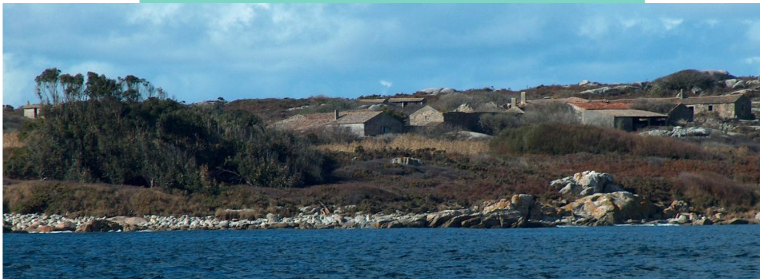
A aldea de Sálvora coa punta de Penaprada no primeiro plano. Abaixo detalles.